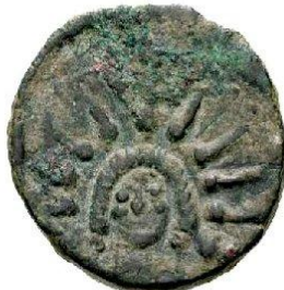
As II ème siècle AC - 25m/m 11.66 gr.