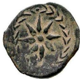
As début I er siècle AC 21 m/m - 6.97 gr.