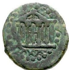
Semis II ème siècle AC - 15 m/m 4.36 gr.