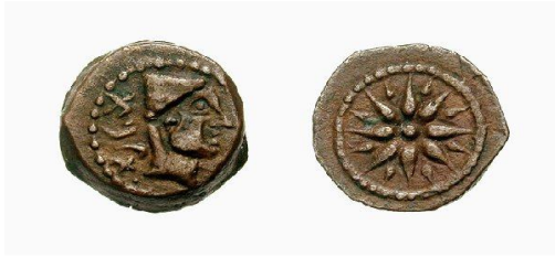
Quadrant II ème siècle avant AC 12 m/m