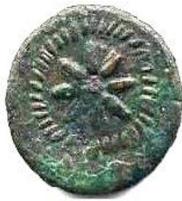
Double as fin du III ème siècle AC - 15.4 gr