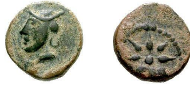
Quadrant fin du III ème siècle AC 11 m/m 2.15 gr.

SEKS (actuellement ALMUÑECAR province de Grenade) Fondation contemporaine de celle de Malaca. Ce comptoir aussi important que celui de Malaga était renommé pour ses salaisons.