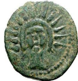
As II ème siècle AC 25 m/m - 10.25 gr.