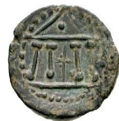
Semis II ème siècle AC 15m/m - 4.11 gr.