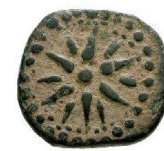
Quadrant fin du III ème siècle AC 11 m/m - 1.56 gr.