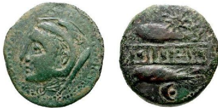
As 1ère moitié du II ème siècle 26 m/m 11.03 gr. Avers : Tête de Melkart coiffé de la peau de lion à gauche Revers 2 thons encadrant MP'LSKS étoile

SEKS (actuellement ALMUÑECAR province de Grenade) Fondation contemporaine de celle de Malaca. Ce comptoir aussi important que celui de Malaga était renommé pour ses salaisons.