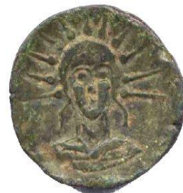
As II ème siècle AC 25m/m - 10.19 gr