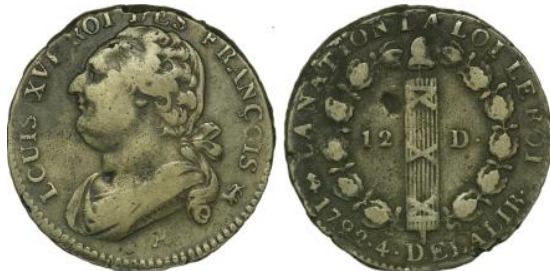
12 deniers 1792 A An 4 Léopard/ Rose