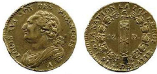
12 Deniers 1791 A Lyre avec un point après le A