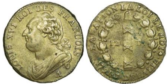
12 deniers 1791 A An 3 Atelier du Louvre (rose)