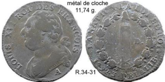
12 deniers 1792 AN 3 A atelier du Louvre