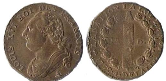
12 deniers 1792 A An 4 lyre