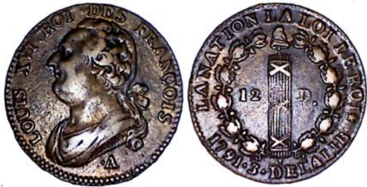
12 deniers 1791 A An3 A pointé/rose (moulin du Louvre)