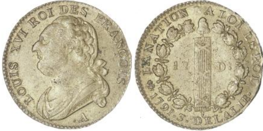
12 deniers 1791 A An 3 A pointé/lyre métal de cloche 11,74 g.