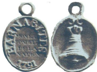
Laissez passer pour la fonderie des Barnabites