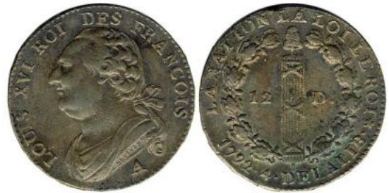
12 deniers 1792 A An 4 à la Rose