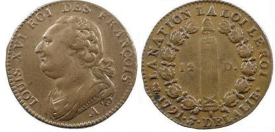
12 deniers 1791 An 3 A Lyre (atelier de la Monnaie de Paris)