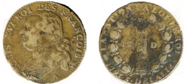
12 deniers 1793 AN 5 A (Monnaie de Paris) Léopard & Lyre