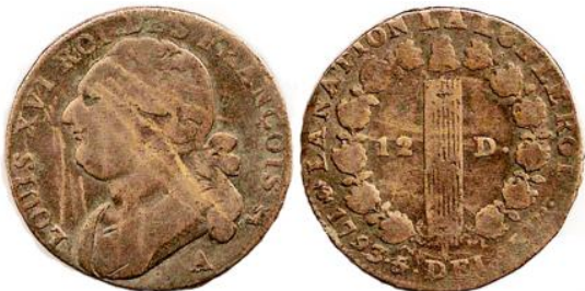
12 deniers 1793 A An 5/4 Léopard & Lyre