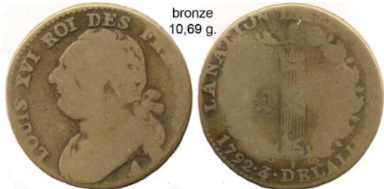
12 deniers 1792 An 4/3 Louvre (rose) bronze 10,69 g.