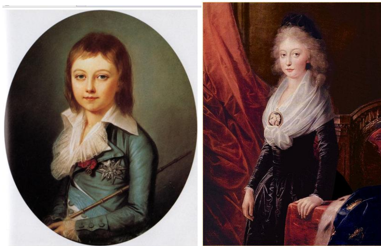
Louis XVII et Marie-Thérèse en 1795

Dans la foulée, Elisabeth, la plus jeune sœur de Louis XVI qui avait lié son sort à celui de la famille royale sera décapitée le 14 mai 1794. Philippe-Egalité la suit de près. Le sort réservé aux deux survivants, Louis Xavier le Dauphin et sa sœur Marie-Thérèse inquiète les cours européennes.