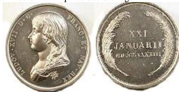
Médaille pour la proclamation de Louis XVII par Loos

Le dernier des capétiens sera donc l'éphémère Louis XVII. Ce dernier n'a jamais régné. Il a été déclaré comme tel le 21 janvier 1793, au soir de la mort de son père par son oncle, le Comte de Provence, futur Louis XVIII qui se déclare régent.