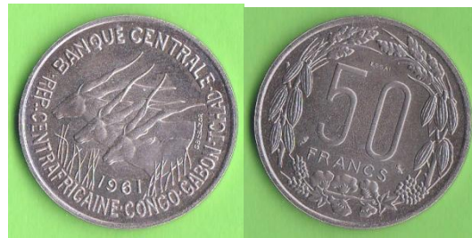
50 francs CFA – 1961