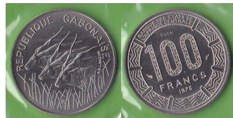
100 francs CFA – 1975 – essai