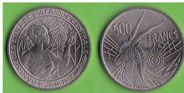
500 francs – 1977 D ( Gabon ).