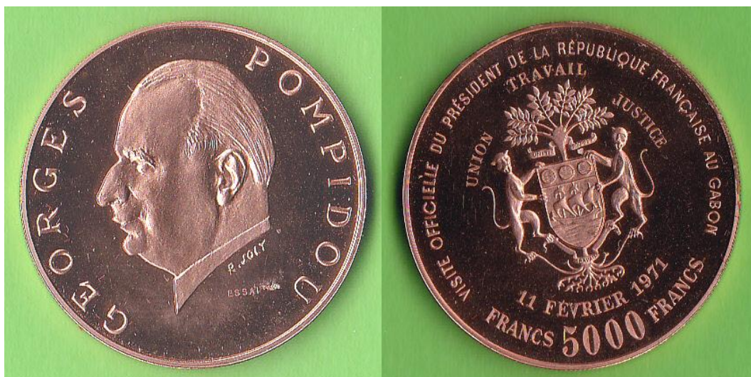
5000 francs – Essai de la monnaie d'or frappée pour la visite du Président Georges Pompidou, le 11 février 1971.