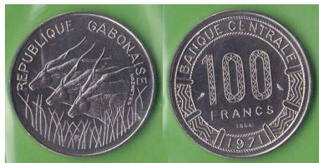
100 francs CFA – 1971- essai