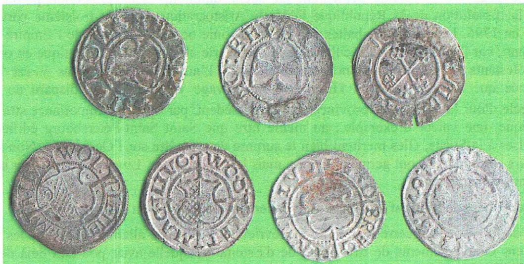
Monnaies des villes de DORPAT (Tartu) et TALLIN et 7 pfennig ou deniers de l'ORDRE LIVONIEN