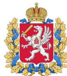
Emblème du gouvernement de Livonie