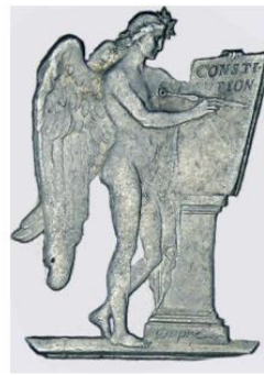
Poinçon de revers