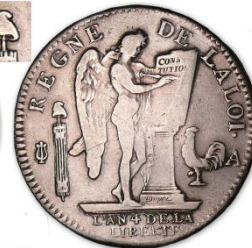
A 1792/2 Variété bonnet à droite